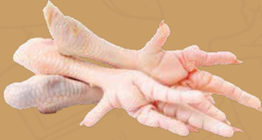
PATAS DE POLLO