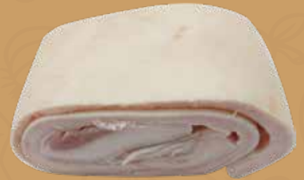
CUERO DE CERDO