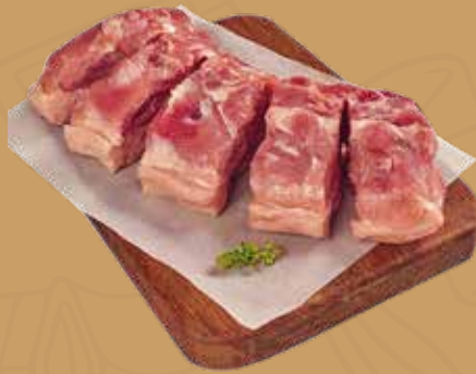
FRITADA CON HUESO