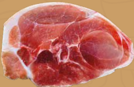
CHULETA PIERNA Y BRAZO