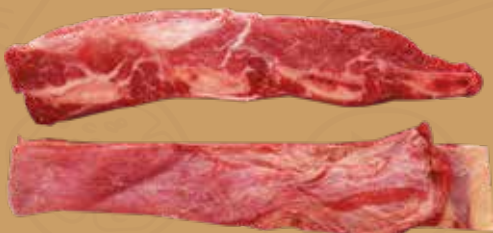
COSTILLA DE RES