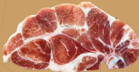
CHULETA DE CUELLO