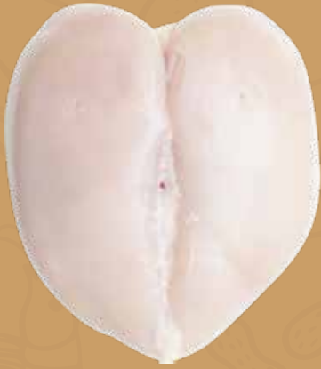
PECHUGA SIN PIEL