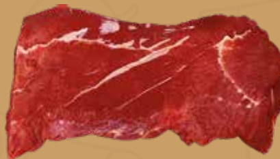
LOMO DE ASADO