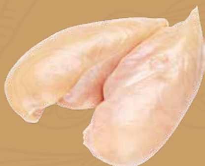
PULPA DE PECHUGA