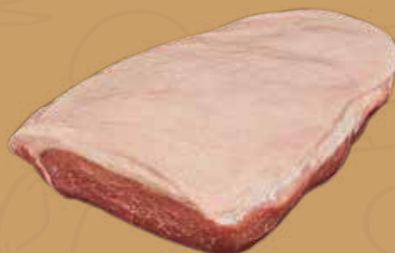
PICAÑA DE CERDO