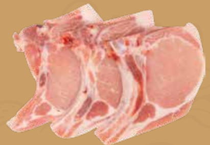
CHULETA DE LOMO