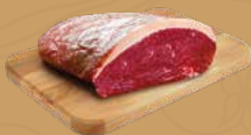
PICAÑA DE RES