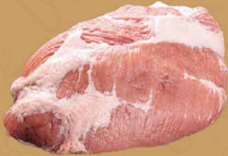
PULPA DE CERDO