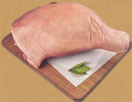
PIERNA DE CERDO