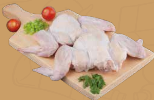
ALA Y ESPALDILLA