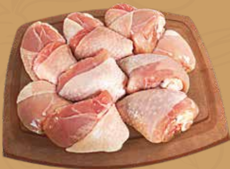
SOPA Y SECO